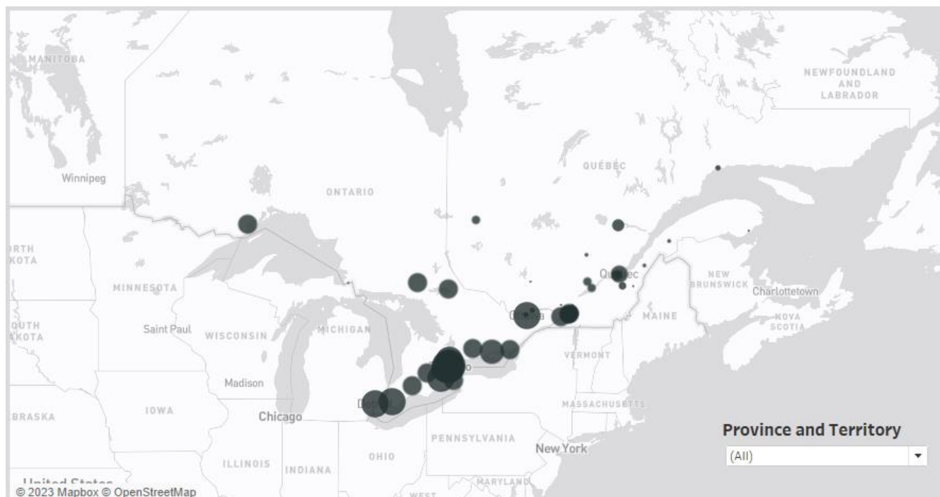
Figure 2 : Répartition par ville

CISSA-ACSEI a réalisé une carte interactive pour visualiser la distribution des cartes cadeaux offertes par METRO inc. On peut consulter la visualisation en ligne (mot de passe dakuju ).